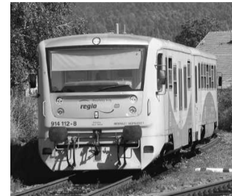
NA REGIONOVU vozící cestující z Rokycan na jih někdo v polovině srpna vypálil ze střelné zbraně.

Kulka zasáhla zelenožlutou Regionovu těsně pod oknem jednoho z vagonů. Nikomu z cestujících se nic nestalo, případ je to však závažný. „Na Plzeňsku se dosud nic takového nestalo,“ potvrdila mluvčí