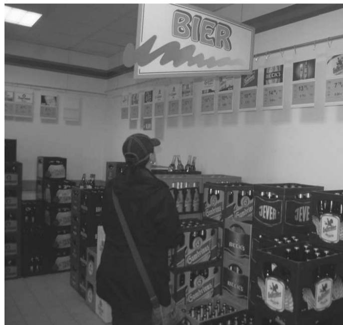
LIDÉ jezdí pro české pivo za hranice. Na půllitru ušetří zákazník i několik korun.

Na dvanáctistupňovém Gambrinusu ušetří lidé v obchodech u našich sousedů přes pět korun