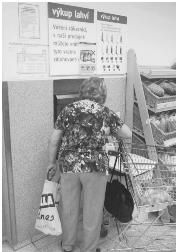
PIVOVAR zavedl pro německý a rakouský trh nové přepravky na Plzeňský Prazdroj. Některé obchody tak varují, že přepravku už nelze vrátit.

Milovníci zlatavého moku jsou rádi, že si mohou jen pár kilometrů za hranice dojet pro levnější pivo. „Stejně je to ale postavené na hlavu a ani netuším, jak je to možné. Proč je